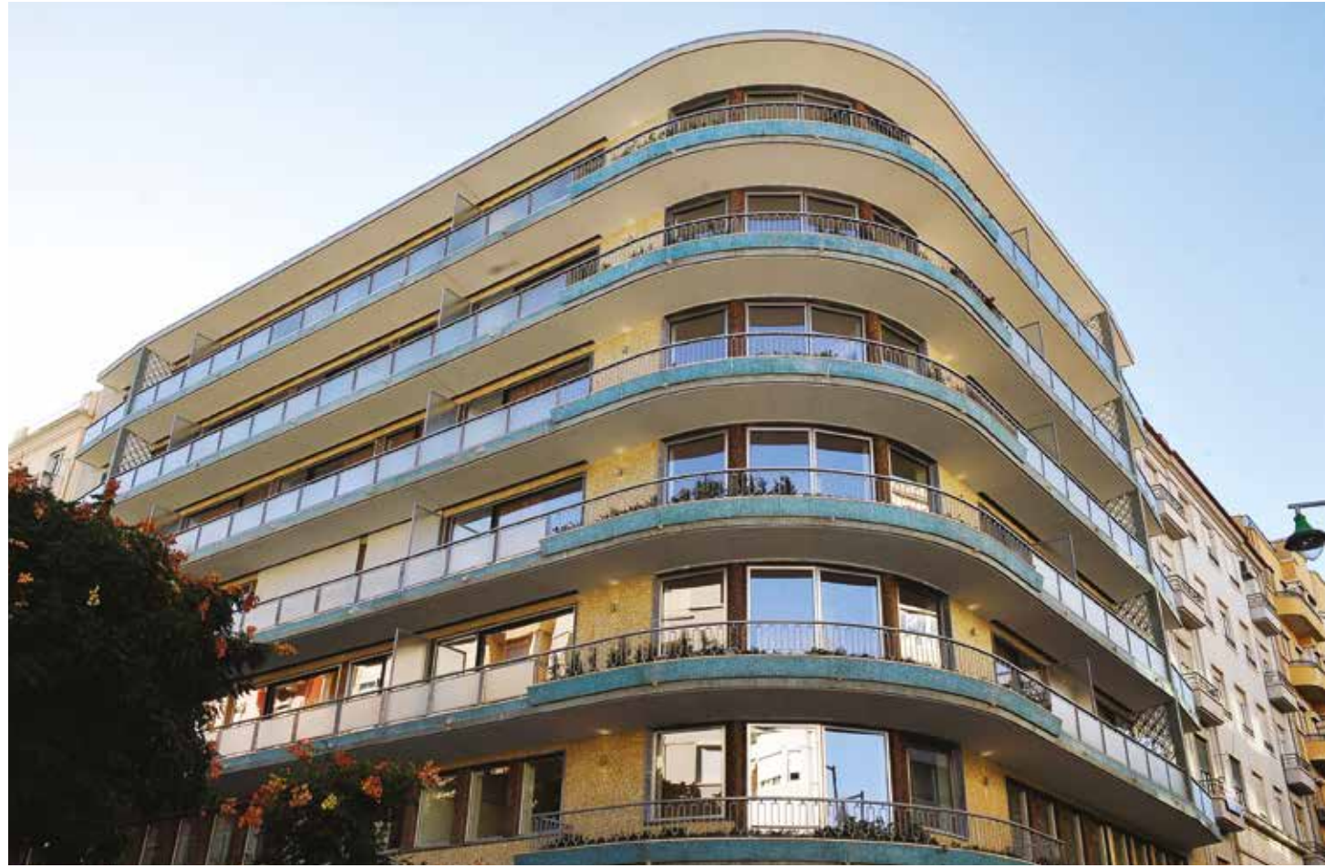
Park Avenue (Lisboa)