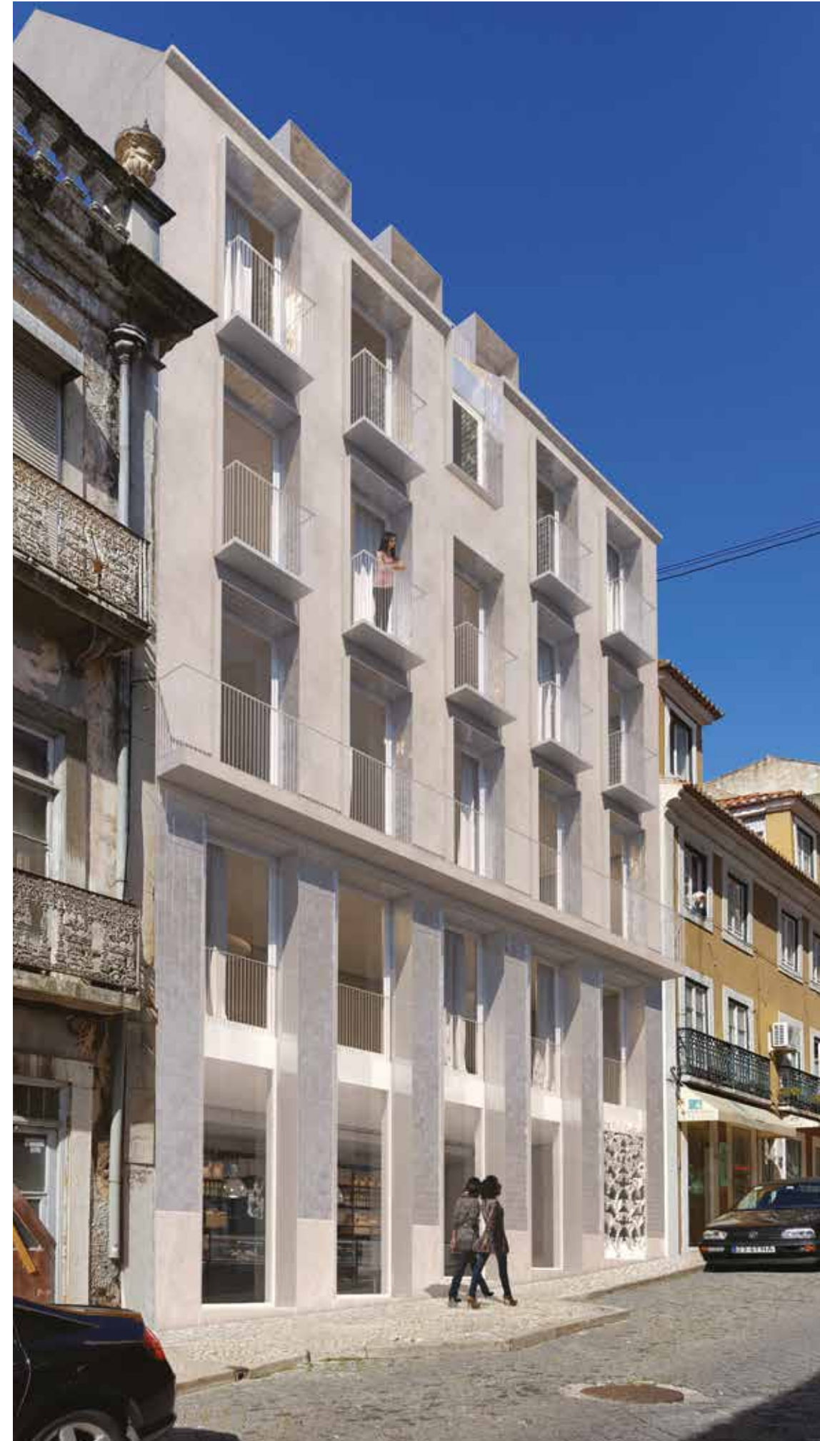
Off Liberdade (Lisboa )