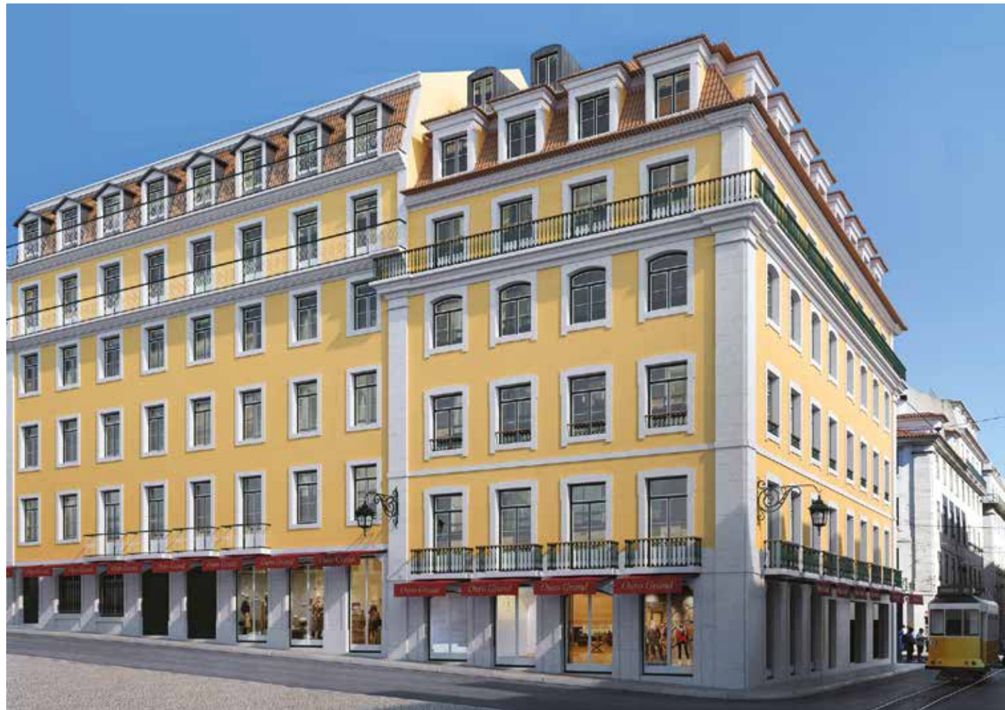
Ouro Grand (Lisboa)